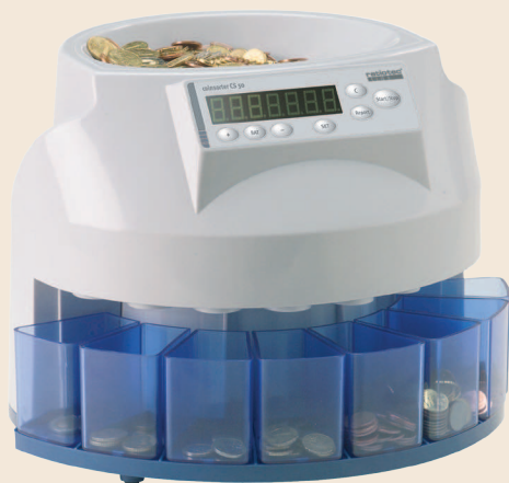
coinsorter CS 50