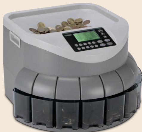
coinsorter CS 150